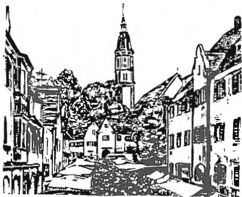
Erstes Rotkreuzlazerett mit Blick auf St. Michael /gez. Dr. Nowey